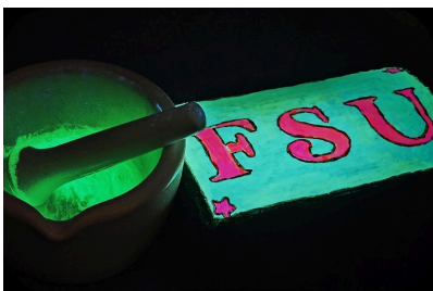
OMHH 소재를 사용해 패브릭에 FSU 약자를 칠한 모습